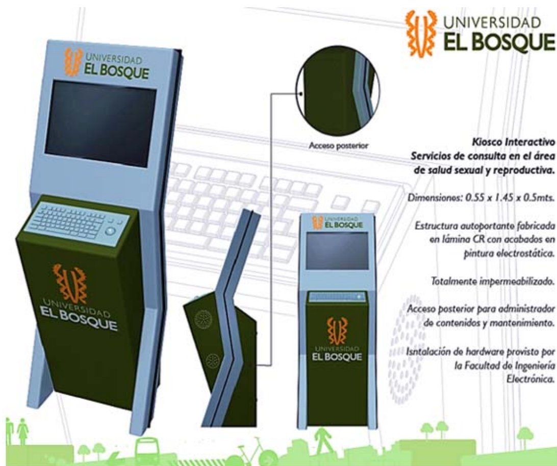
Fig. 1 - Módulos tipo kiosko: interfaz gráfica.