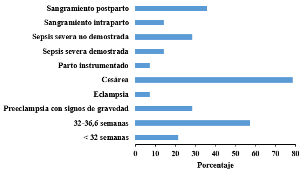
Figura 2. Complicaciones de las embarazadas adolescentes.

La Figura 2 muestra las complicaciones maternas de las embarazadas adolescentes, en las que el parto pretérmino ocurrió en 11 de las 14 (57,1 %), entre las 32 y 36,6 semanas y con menos de 32 semanas en el 21,4 %.