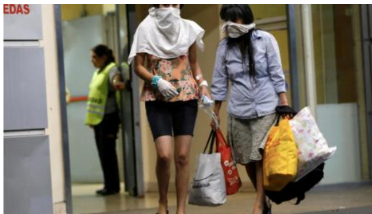
Figura 2. Representación gráfica del género en relación al COVID-19 [11]

En este punto se plantean algunas interrogantes: ¿Cómo se manifestará la desigualdad de género bajo estas condiciones de aislamiento a causa del COVID-19?, (Fig. 2) ¿Afectará de la misma forma a hombres y mujeres?, ¿La expresión de la sexualidad será la misma? [10].