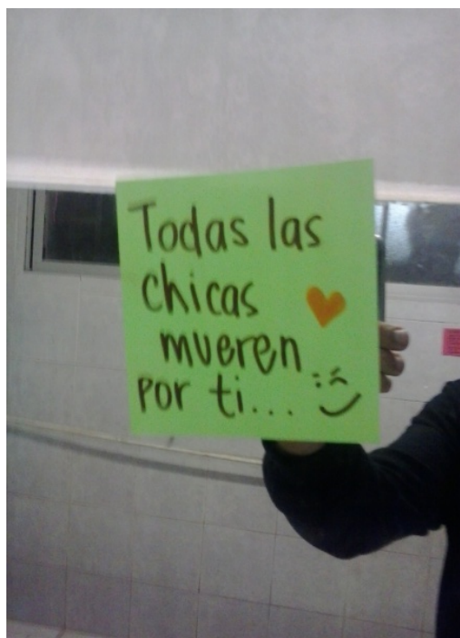
Figura 1: Espejo del baño de hombres

Día 4: 23.15 hrs. Estoy cepillándome los dientes en el baño de hombres, justo antes de irme a dormir y que se haga el llamado a silencio dentro de la escuela. Las instalaciones muestran la suciedad y desorden propios del final del día y el uso intensivo antes de la acostada. Al entrar en la zona de los lavamanos puedo comprobar que en los espejos han sido dispuestos unos post-it con algunos mensajes que buscaban -supongo- amenizar la experiencia y personalizar el espacio. Probablemente habían sido dejados por la cuadrilla que esa mañana había limpiado los baños. Puedo leer pequeñas frases que tienen por objeto subir la autoestima de los varones que ocupábamos ese lugar (figura 1). Intrigado, me pregunto si en el baño de las mujeres habría algo parecido. Una vez afuera, le pido a una de las estudiantes con las que trabajé en la mañana que me hiciera el favor de tomarles fotografías con mi teléfono móvil a los mensajes que pudiera haber en el baño de mujeres. Después de 3 minutos compruebo que allí también había post-it, pero que la naturaleza de los papeles pegados era completamente distinta: mientras a ellas se les daban consejos para cuidar su aspecto (figura 2), a nosotros se nos hablaba del deseo que podíamos provocar en las mujeres, sin tener que hacer nada para atender nuestra apariencia. (Anotación cuaderno de campo. Martes 6 de enero de 2015)