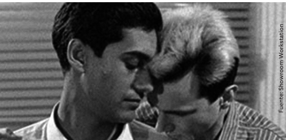
Foto: Mi bella lavandería

El cine francés llegó con dos películas. Una dentro de la semana del cine francés, Los juncos salvajes ( Les roseaux sauvages , André Téchiné, 1994), cuyo director es considerado heredero del espíritu de la nueva ola francesa. Ambientada en 1962, año de la independencia de Argelia, plantea adecuadamente las tensiones políticas y sexuales de aquel entonces y el acercamiento de un joven burgués a otro de clase trabajadora. Los intérpretes