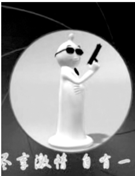
Comercial chino de condones

En la promoción —comercial o preventiva— del condón, la inteligencia construye el mensaje. El condón masculino se ha integrado ya a los artículos cotidianos. Más de 95 por ciento de los mexicanos conocen o al menos han oído hablar de la pequeña funda de látex, aun sin saber bien a bien la forma en que se usa.