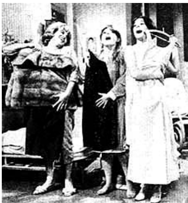
Imagen 4. Las chicas (1965)

Los sketches cómicos de Violeta y Néstor revelan, en este mismo sentido, un modelo de hombre y otro de mujer: la joven es la que desea un novio para casarse, la que tiene miedos y necesita que