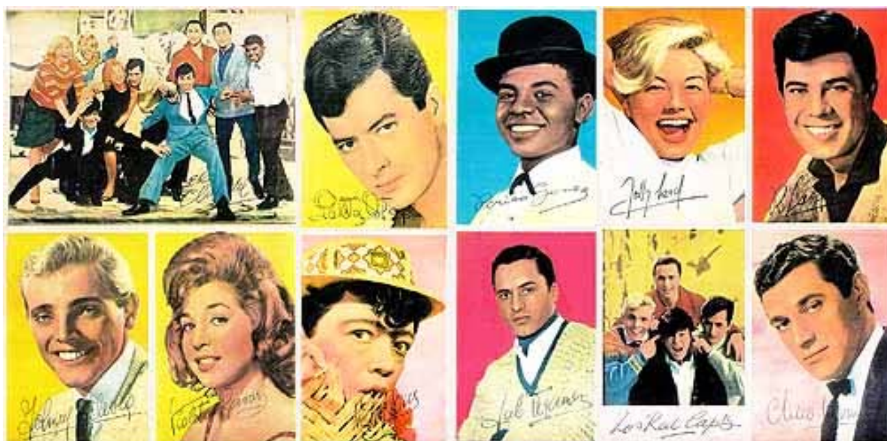
Imagen 1. Fotografías autografiadas de los ídolos de El club del Clan (1962/1963)

el verdadero tono de cabello del ídolo, mientras que los colores brillantes de los vestuarios y los fondos les dan vida a los personajes; retratos hechos a imagen y semejanza de otro mundo de las celebridades —especialmente el hollywoodense— que ya era a todo color. En cine, habría que esperar hasta 1969 para ver a Rivas y Ortega cantando en colores en ¡Viva la vida! , de Enrique Carreras. El color suma alegría a la imagen que ya la representa con peinados, poses y sonrisas; pero, sobre todo, el color es el signo más reconocible de toda una industria cultural destinada a las masas. Los colores, notablemente ausentes en Argentina en el medio que se convertiría en una de las patas más fuertes de esa industria —la televisión—, ponen de manifiesto el atraso tecnológico del país