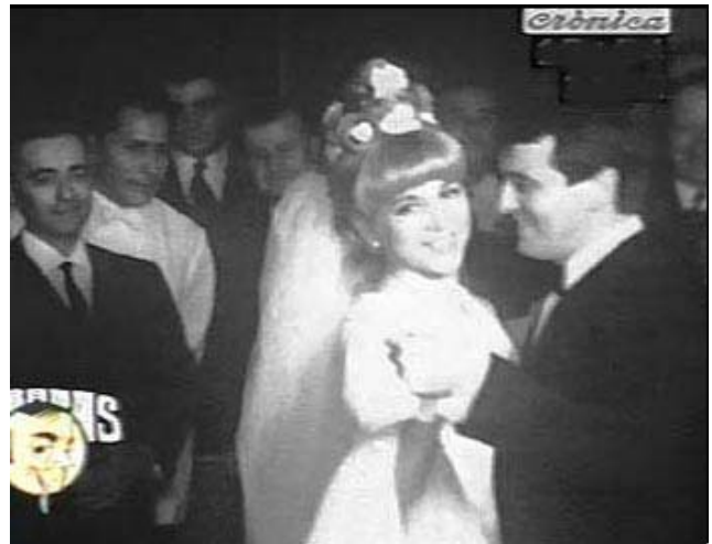
Imagen 7. Sábados circulares (1967)

precisamente la de un joven moderno, sino la de un tradicional cantante de tango. 12