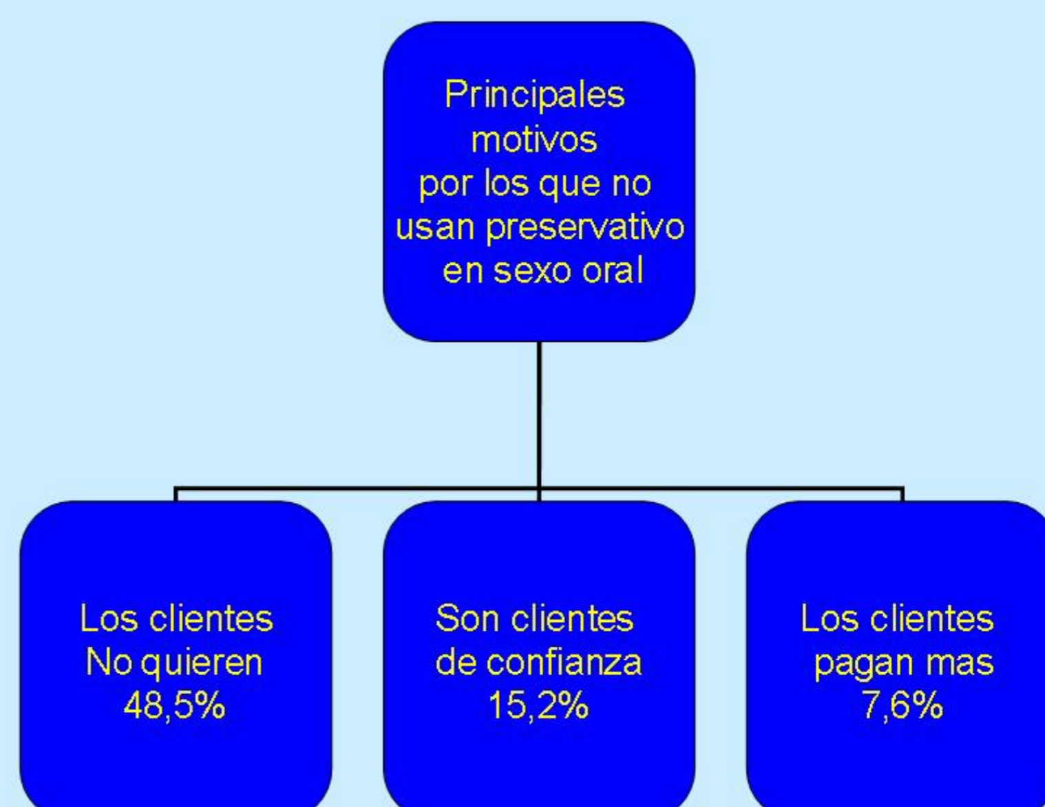
USO PRESERVATIVO RELACIONES CON CLIENTES