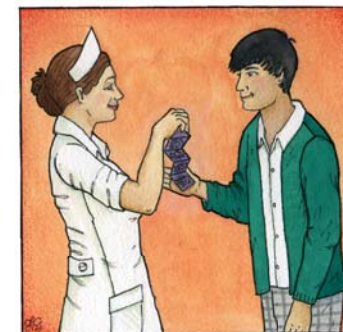
Servicios de salud sexual y salud reproductiva