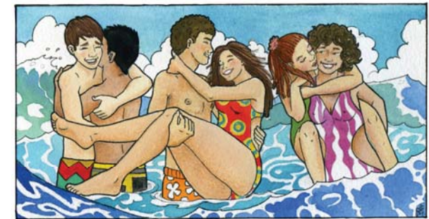
Manifiestar públicamente mis afectos