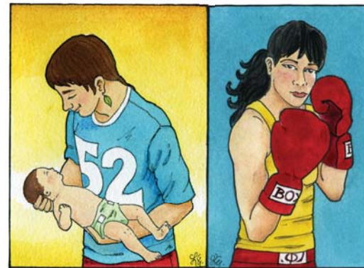
Igualdad de oportunidades y equidad