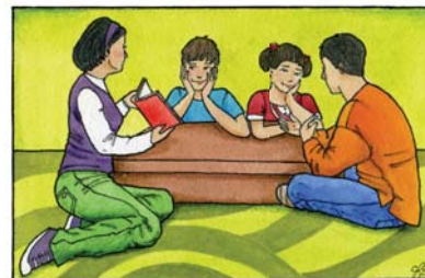
Información y Educación Sexual