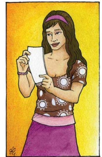
Ejercer y disfrutar plenamente mi vida sexual