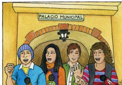
Participación en las políticas públicas sobre sexualidad