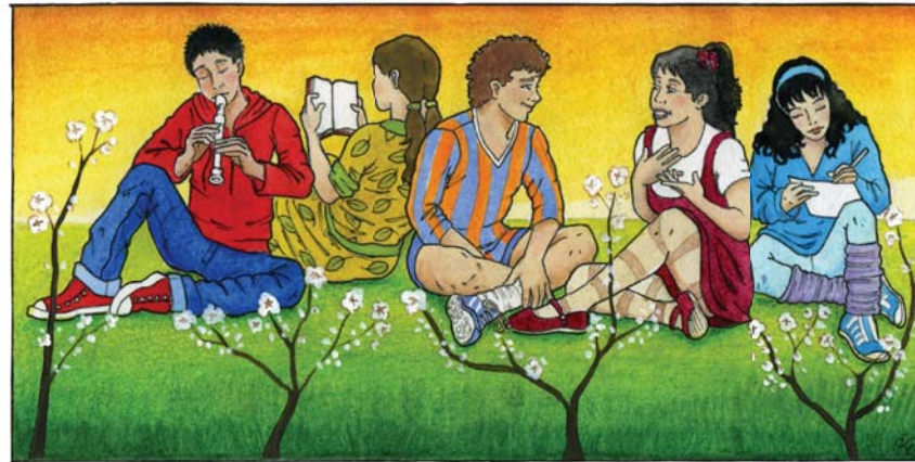
Decidir de forma libre sobre mi cuerpo y mi sexualidad