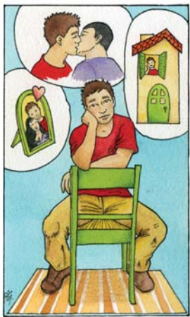
Decidir con quién compartir mi vida y mi sexualidad