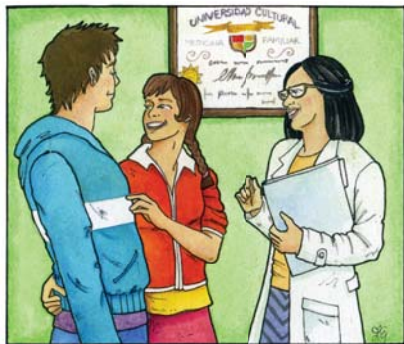
Respeto de mi intimidad y mi vida privada