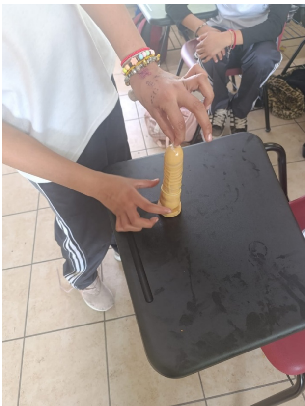
Nota. Fotografía tomada por el autor en 2025.

Se identificaron creencias diversas: muchos desconocían la importancia del condón y sentían vergüenza, asociando su uso con promiscuidad. Al concluir el taller, los alumnos comprendieron la relevancia del condón para el autocuidado y la protección de parejas, ya sean estables u ocasionales, reforzando la importancia de tomar decisiones sexuales responsables.