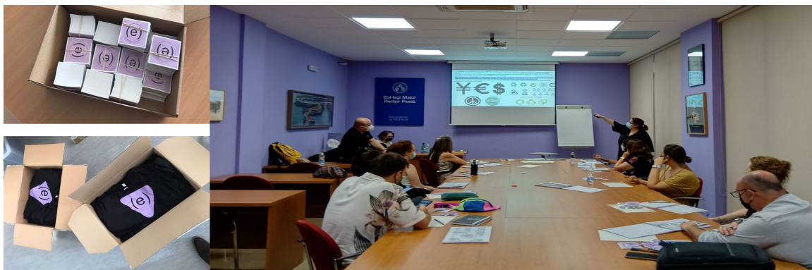
Figura 3. Presentación del Taller de Diseño de Identidad Visual Inclusiva en el Col.legi Major Rector Peset. Valencia.