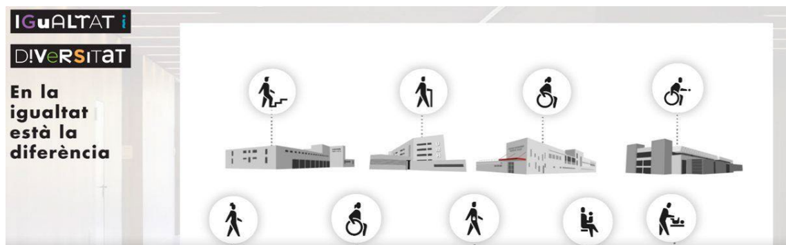
Figura 2. Pictogramas inclusivos de la UMH.

cambio y generar reflexiones tanto a nivel conceptual como gráfico y artístico en diversos contextos educativos, tanto universitarios como de enseñanzas medias. Se trata de poder llegar hasta el alumnado de secundaria, sujetos clave en la recepción y enseñanza de valores inclusivos y de igualdad, y que a través del grafismo pueden entender los referentes y los conceptos, para crear sus propias imágenes a través de dichos talleres impartidos a los docentes, actores fundamentales en la transmisión de conocimientos transversales.