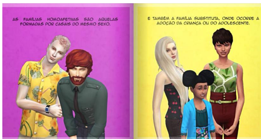
Figura 2. Parte de la historia sobre configuraciones familiares