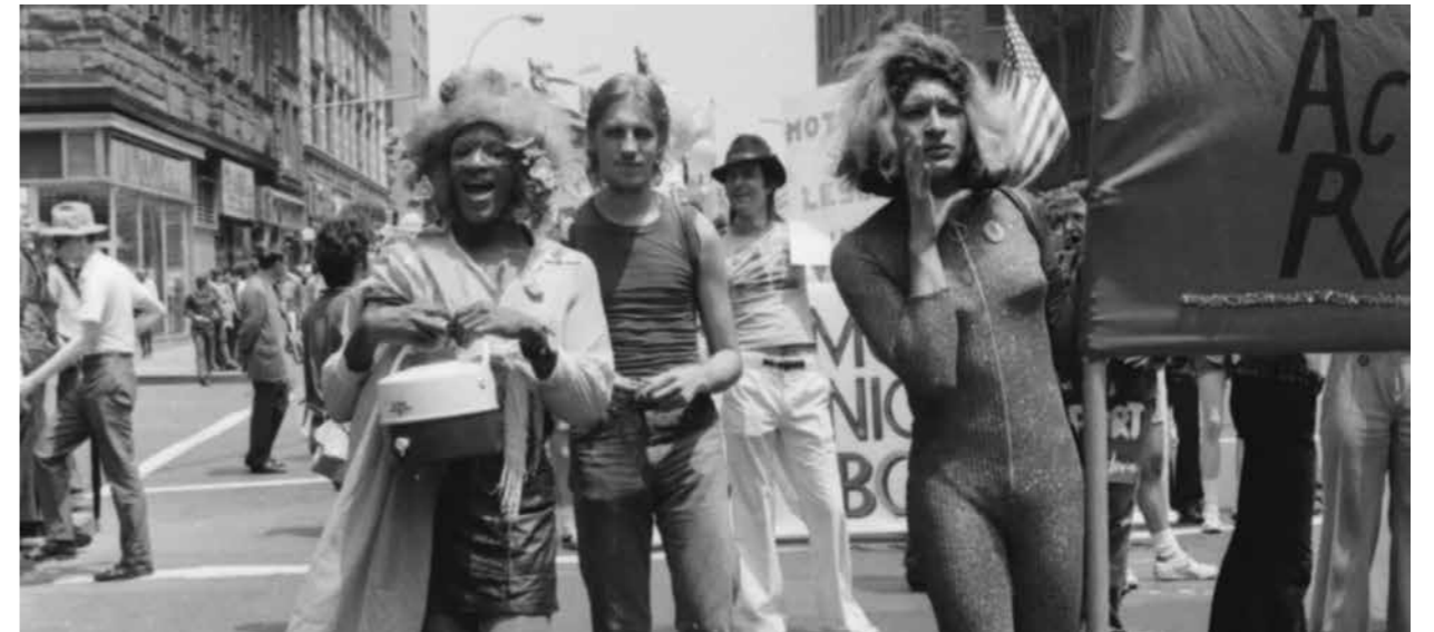
Marsha P. Johnson i Sylvia Rivera.

Marsha P. Johnson i Sylvia Rivera eren dues desclassades dins dels desclassats: pobres, transsexuals, llatina una i negra l'altra, totes dues havien exercit al carrer. Van ser precisament aquestes dues persones, juntament amb d'altres com elles, que no posseïen res, les que més violentament es van enfrontar amb la policia, doncs no estaven disposades a deixar que els hi robessin l'única cosa que els quedava, la llibertat i la dignitat.