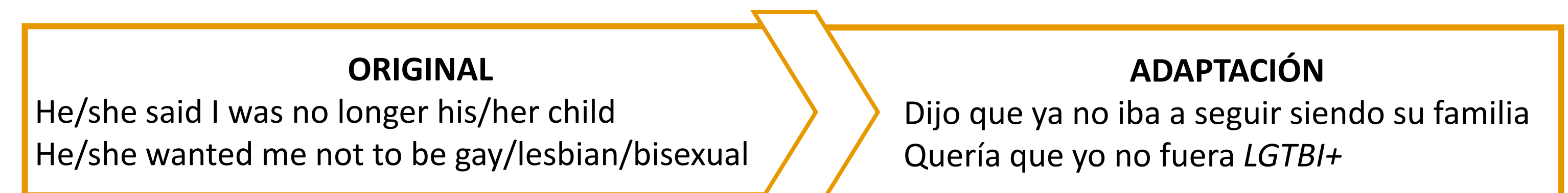
Figura 1. Ejemplos de ítems adaptados

La escala original constaba de 32 ítems y un solo factor. No obstante, para abarcar a todo el colectivo LGTB+ y a diferentes figuras familiares, se eliminaron dos ítems de la escala original que abordaban temas como el matrimonio igualitario y las parejas del mismo sexo, y se adaptó la redacción de los ítems restantes (Figura 1). Para finalizar, se realizó la traducción de la escala mediante juicio de expertos.