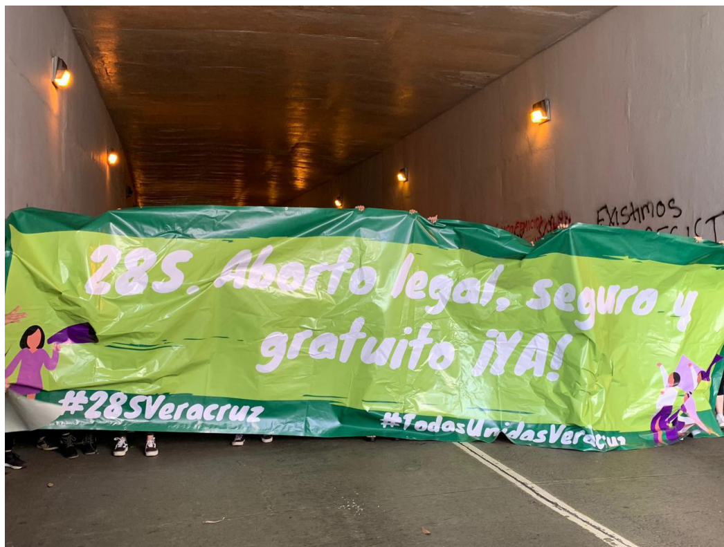
Imagen 2. Marcha por el 28 de septiembre, Día de Acción Global por el Acceso al Aborto Legal y Seguro.