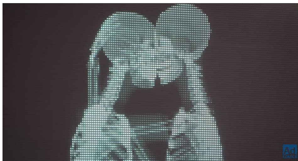
Love Has No Labels | Diversity & Inclusion | Ad Council

https://www.youtube.com/watch?v=PnDgZuGIhHs