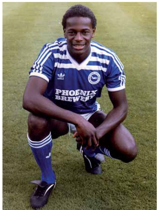
Justin Fashanu es va suïcidar l'any 1998 després de ser acusat falsament d'una agressió sexual