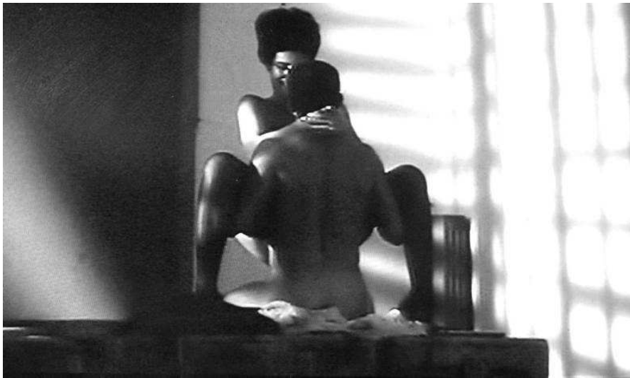
Figura 5. Foto de presa d'apertura de Matador . Pedro Almodóvar.