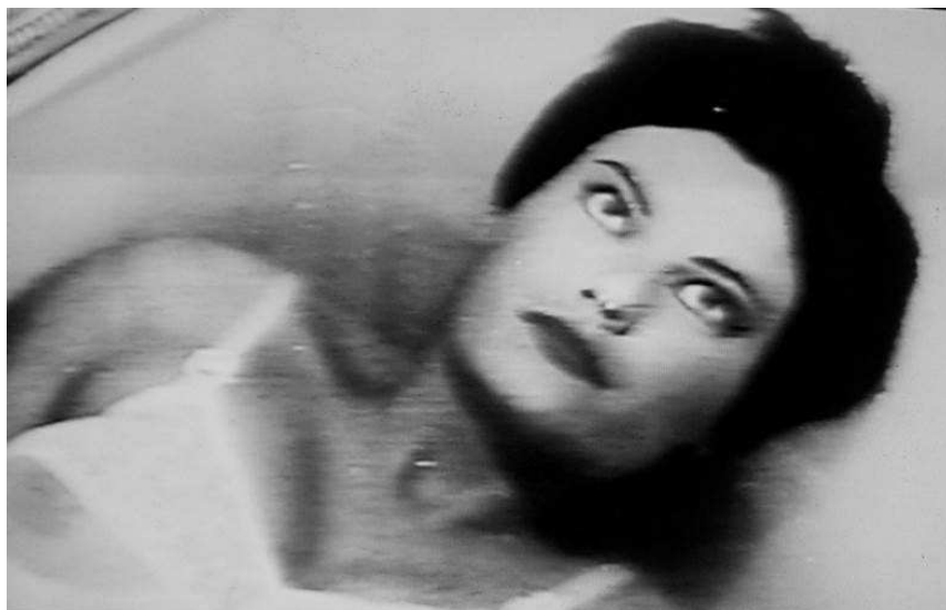
Figura 2. Foto de la presa d'apertura de Matador . Pedro Almodóvar.