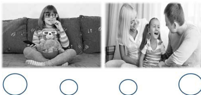
Figura 1. Lámina del ítem 2

Claudia quiere mucho a su tío Manuel. Manuel le ha dicho que vayan a ver una película a su casa, que tiene palomitas y muchas gomitas. Pero también la ha dicho que no le diga nada a su papá. Claudia no sabe qué hacer. ¿Qué harías tú?