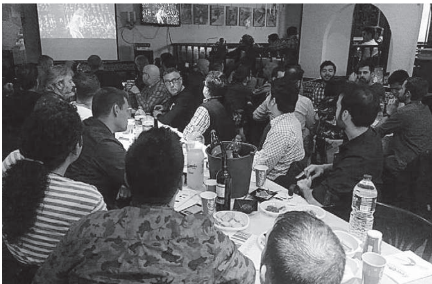
Sopar d'Eurovisió al c/ Verdaguer i Callís, 2015