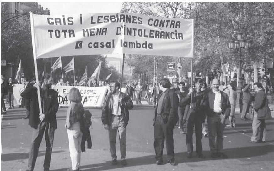
Manifestació contra el racisme, 1992