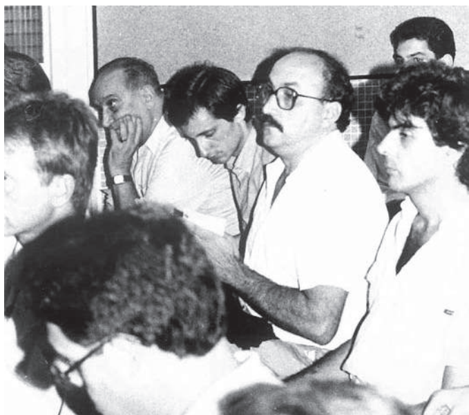
Assemblea del Casal Lambda a la seu del C/ Picasso

El Casal Lambda és un actor amb un paper important en el desenvolupament del moviment LGBTI a casa nostra, juntament amb d'altres entitats. Durant la dècada dels setanta del segle passat l'objectiu va ser organitzar el moviment LGBTI i despenalitzar l'homosexualitat; als vuitanta, lluitar contra la discriminació de gais i lesbianes i contra la sida; als noranta aconseguir la igualtat legal; a la primera dècada del segle XXI, aconseguir la igualtat social i legal; a la segona dècada lluitar contra l'homofòbia i a favor de la diversitat i la inclusió. A continuació presento les principals fites històriques aconseguides. Tanmateix, molt camí resta per fer en un futur ple d'incerteses i amenaces.