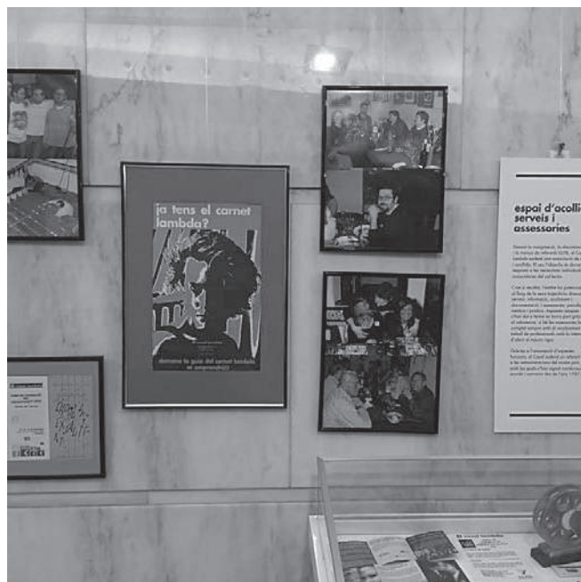
Exposició del 40è aniversari del Casal Lambda

Molts reptes resten pendents encara en un panorama europeu on creix la por, la desigualtat, els grups neocons, el feixisme i la intolerància: el bullying a causa de l'orientació sexual, l'educació en la diversitat, la gent gran LGBTI, les famílies monoparentals, els drets dels transsexuals, la solidaritat internacional, els emigrants LGBTI, la solidaritat amb les persones seropositives, la visibilitat arreu del territori i no només a la ciutat de Barcelona, etc. El moviment LGBTI no ha culminat la seva tasca i el Casal Lambda esdevé encara imprescindible dins d'ell.