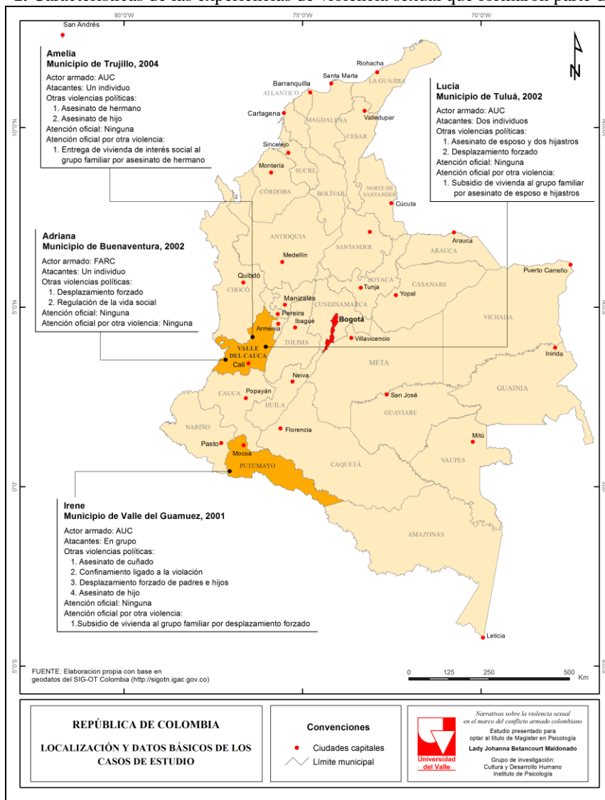
Mapa N° 1. Características de las experiencias de violencia sexual que formaron parte del estudio.

No obstante, es importante precisar que no existen estadísticas claras que permitan contrastar entre periodos y confirmar que efectivamente fueron más o menos las violaciones que los paramilitares cometieron durante estos años. Además, si existieran, no serían del todo fiables, pues como lo dice Vigarello (1999), la sensibilidad frente a la violencia sexual en occidente ha variado con el tiempo y esto altera las estadísticas, tanto así, que hemos transitado de un pasado silencioso a un presente escandaloso. Aun así, no deja de ser inquietante que el auge de un grupo armado coincida con un mayor número de reportes de todo tipo de