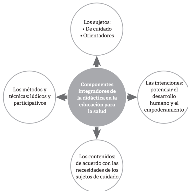
Figura 2. Componentes integradores de la didáctica en la educación para la salud

En la Eps las denominaciones docente/estudiante, enseñante/aprendiz o educare/educere no son adecuadas, porque sugieren autoridad dada por el conocimiento –el docente posee un saber que transmite al aprendiz–, que le asignan al aprendiz un rol pasivo. Esta relación vertical dificulta el diálogo de saberes y prácticas tan necesario en la Eps, por eso es preferible hablar de sujeto de cuidado (sc) y sujeto orientador (so).