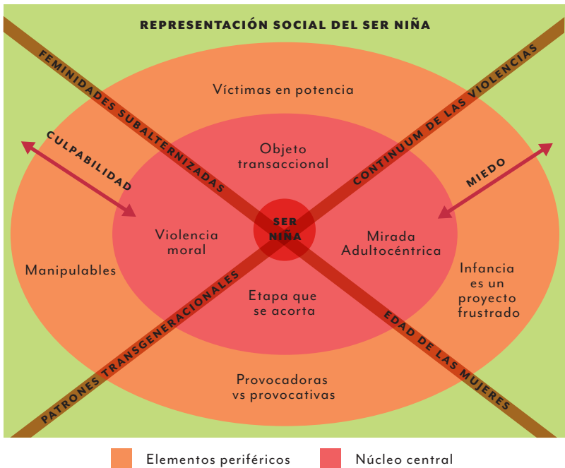
Figura 3. Esquema de la representación social del ser niña.

Por esta razón, a continuación, expondré los diferentes elementos contenidos en el nivel central y periférico de la representación social identificada entorno al ser niña, por parte de actores comunitarios e institucionales de los municipios focalizados, los cuales se ejemplifican en la figura 3.