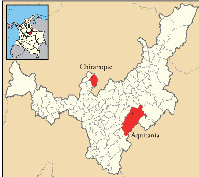
Figura 1. Municipios de Chitaraque y Aquitania en Boyacá.