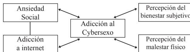
Figura 2. Modelo final de variables

La ansiedad social es un temor generalizado ante la interacción directa con otros, incluye la predisposición a ser fácilmente persuasible y atender a las evaluaciones de los otros. Schlenker & Leary (1982) mencionaron que surge de imaginar o inferir evaluaciones o impresiones negativas por parte de los otros. Kimbrel (2008) afirma que implica hipersensibilidad a la estimulación, con temor generalizado hacia actuaciones en público, que se evidencia por una alta reactividad de la amígdala, con lo que concuerdan otros autores como Antona, Delgado, García & Estrada (2012), Kambouroupoulos, Egan, O'Connor, & Staiger (2014), Labuschagne et al. (2010). Lee & Stapinski (2012) encontraron que la ansiedad social, por su parte, está asociada con la evaluación negativa de las relaciones interpersonales. Lo que una vez más corresponde con lo formulado desde 2005 por Ortiz-Gómez y Muñoz-García (2005) para el caso del uso patológico de internet.