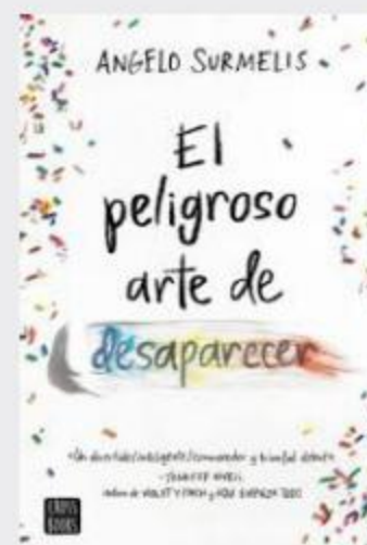
EL PELIGROSO ARTE DE DESAPARECER