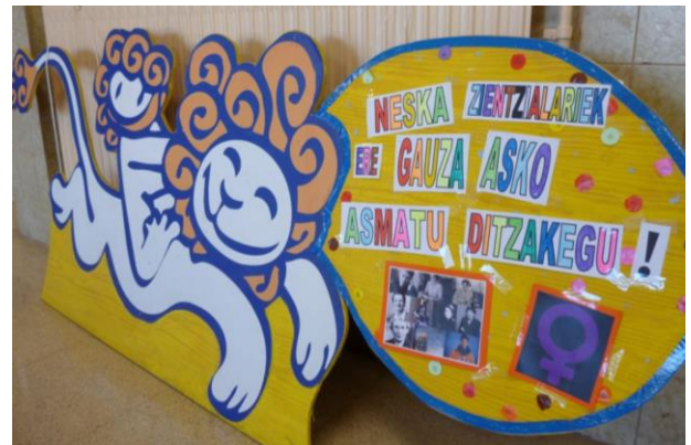
Imagen de nuestro logo, “Hegoleo”, en la entrada de la ikastola el día 11 de febrero, Día Internacional de la Mujer y la Niña en la Ciencia. (Texto: las mujeres también inventamos)

“Modelos de familias”. Trabajo realizado en El para visibilizar distintos tipos de familias. Para la realización del mural se utilizaron fotografías traídas de casa lo que supuso la implicación de todas las familias.