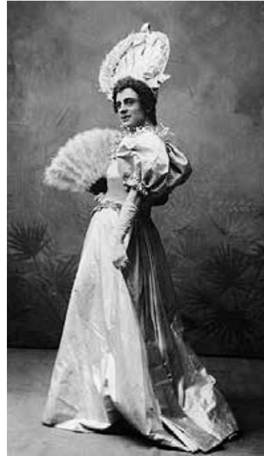
1. Calamity Jane

En 1910 Magnus Hirschfeld va crear el terme "transvestisme" com a propi de persones que voluntàriament utilitzaven vestimentes socialment assignades al sexe oposat