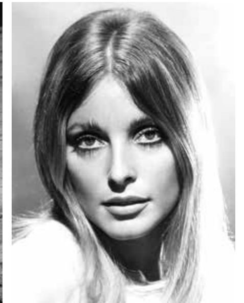
1969, de la proesa a l'horror: Missió Lunar Apollo XI (esq.) i l'actriu assassinada Sharon Tate (dta.).