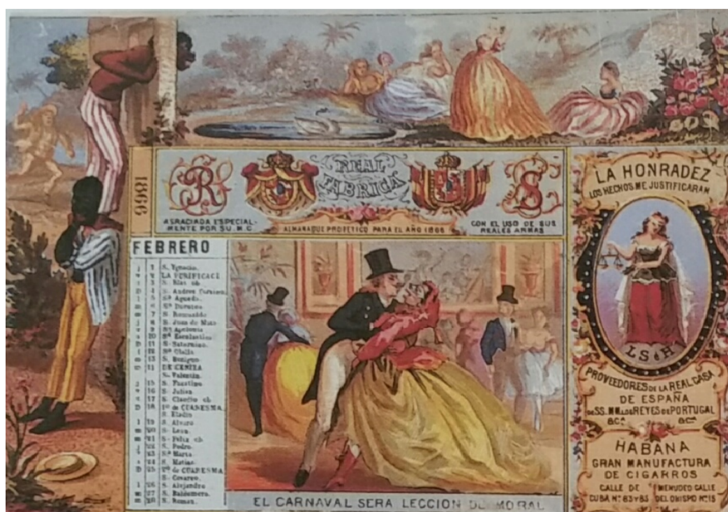
Figura 3. “El carnaval será lección de moral”. Tomado de Núñez Jiménez (1989: 106)

Consecuentemente, la misma idea del deseo que sentían los esclavos por sus amas reaparece en la literatura de la guerra de independencia a favor de España y en las marquillas cigarreras de la fábrica La Honradez. En una de estas últimas se representa a dos esclavos miran a través de un agujero un grupo de mujeres divirtiéndose en el campo (Figura 3). Las mujeres están solas a la orilla de un lago en el cual parece que se van a bañar. La más alejada y pequeña del grupo (la primera a la izquierda) parece no tener ropa en la parte superior de su cuerpo, mientras que la que está parada luce como si fuera a quitarse los aretes. En todos los casos las mujeres lucen completamente inocentes de lo que podía sucederles y los esclavos, vigilantes.