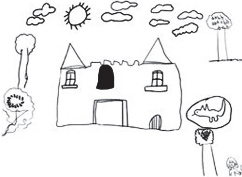
Figura 2. Dibujo de niñas de lo que más les impactó del video que observaron. Diana Bazán, 2007.

casa se dibujó un individuo que, por su cabellera, se puede deducir que se trata de una mujer. Está en estado pasivo, como si durmiera. La mirada de esta mujer está dirigida hacia un crucifijo (así especificado por los autores del dibujo).