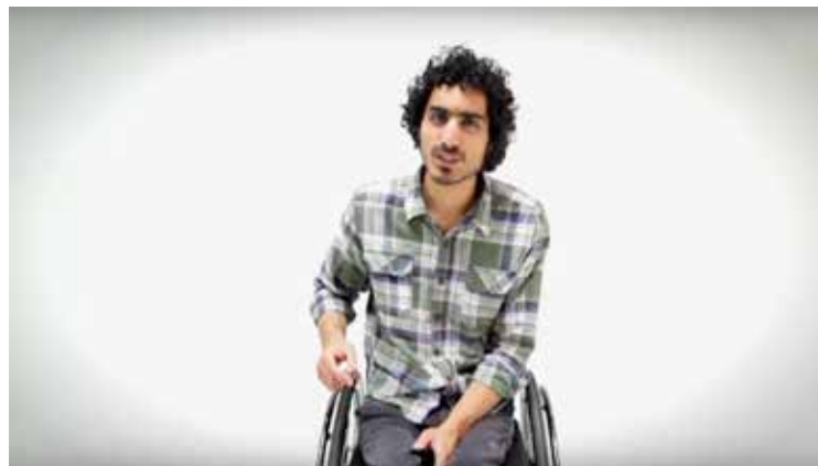
Figura 5. El presentador del video “lesión medular y sexualidad.”

Estos discursos intentan transmitir experiencias sexuales que se escapan a las prácticas de la sexualidad falocéntricas, apelando a cierto acercamiento entre la experiencia de la persona con discapacidad y las demás. El sentido que parece sobrevolar estos discursos es el de normalización de la sexualidad “extraña”, a través de representaciones que cargan con una retórica realista. La misma, según Garland-Thomson, reduce la “distancia” entre el observado y el observador, “regularizando la figura discapacitada para evitar la diferenciación y despertar la identificación frecuentemente normalizando y por momentos minimizando la marca visual de la discapacidad” (Garland-Thomson, 2002b:199. La traducción nos pertenece). En este sentido, es sugerente la imagen del presentador del video y la foto que acompaña el artículo de Andrea de María. En el video, como ya dijimos, la vestimenta y la actitud del presentador lo muestran como a un joven más, desinhibido, pero sin llegar a lo maravilloso (fig. 5). En el segundo caso, un joven en silla de ruedas vestido con campera de cuero y jean, es acompañado por una joven mujer que parece ser su pareja. La joven impulsa su silla cruzando una calle mientras lo mira sonriendo (fig. 6).