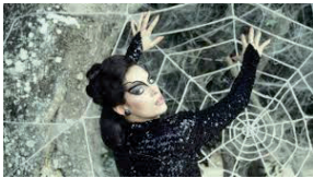
El beso de la mujer araña , 1985 (del mismo director que la cinta anterior Pixote) Héctor Babenco y basada en la novela homónima de

Se exhibió en el Festival de Cine de San Sebastián así como en el de Toronto y en el de Lorcano.