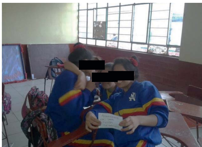
Imagen 2. Adolescentes desarrollando una discusión de casos