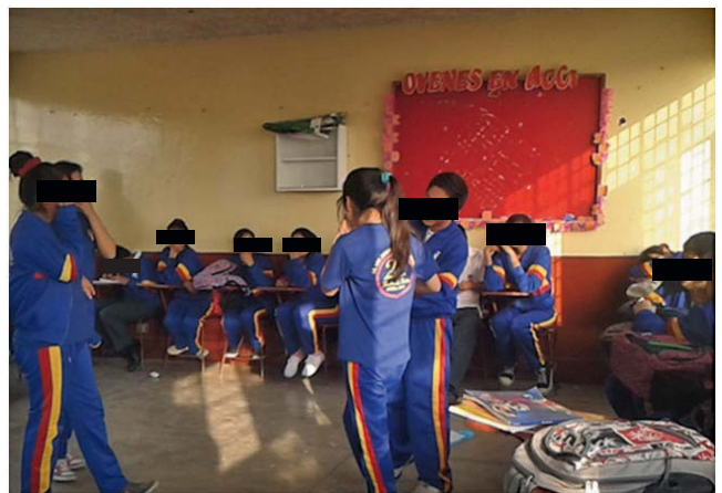
Imagen 1. Adolescentes desarrollando un sociodrama

Se utilizó SPSS 22.0, EPIDAT3.1 y Microsoft Office Excel 2010 para el análisis descriptivo, para el análisis de datos intervinientes se usó la distribución de frecuencias y porcentajes, y posteriormente se aplicó la Prueba de Wilcoxon, para muestras relacionadas, que es una prueba no paramétrica, ya que la muestra no es de distribución normal.