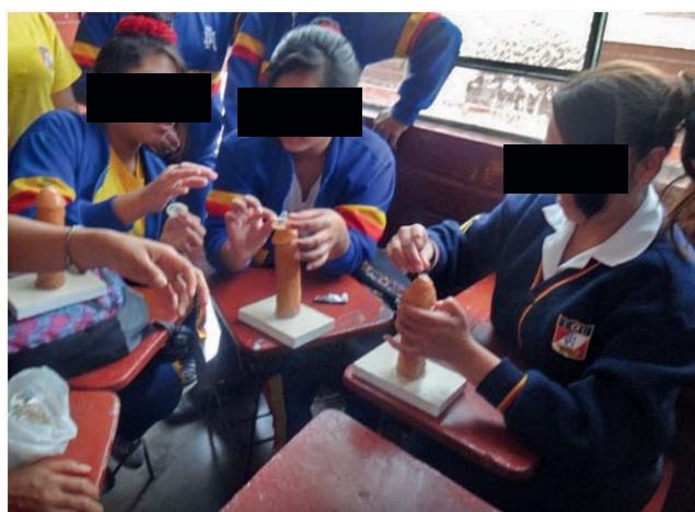
Imagen 3. Adolescentes en un taller sobre el uso correcto del preservativo masculino