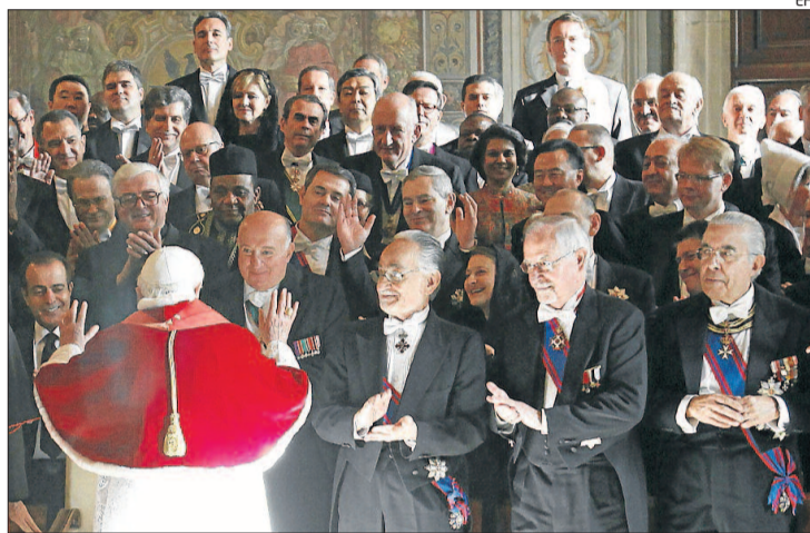
Benet XVI, en la rebuda d'ahir dels 178 ambaixadors al Vaticà.

El Papa també va citar com a amenaça a la llibertat religiosa que en alguns països europeus s'hagin imposat cursos d'educació sexual o cívica, «que transmeten una concepció de la persona i de la vida pretesament neutra, però que en realitat reflecteixen una antropologia contrària a la fe i a la justa raó». Segons va dir el portaveu vaticà, Federico Lombardi, amb aquestes paraules el Papa es referia de manera implícita «al succeït a Espanya», on la Conferència Episcopal ja va manifestar la seva preocupació per la publicació de manuals sobre sexualitat per a es-