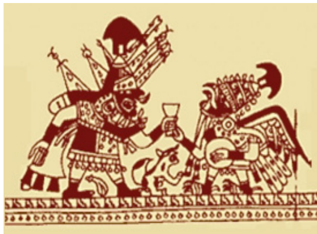
Figura 1. Iconografía de la escena de «presentación o sacrificio» donde se evidencia al Señor recibiendo la copa con la sangre de un sujeto sacrificado.

que dicho personaje de la iconografía no constituyó, como suponíamos los arqueólogos y estudiosos, solo una representación mítica» (Alva 2004, 112-116).