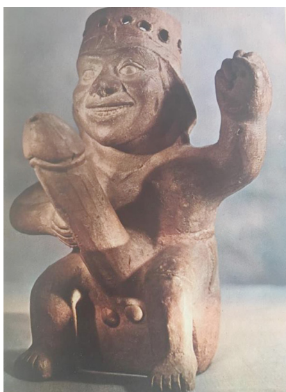
Figura 7. Representación fálica en cerámico moche.

Otras piezas de cerámica muestran otras actividades sexuales, y que involucran a sexos opuestos o escenas de masturbación individual o en pareja. A continuación, describiré algunas piezas representativas de una tipologización basada en ciertos atributos que podrían considerarse como atribuibles a un cuerpo masculino. Un buen grupo de ceramios representan sujetos con miembros enormes, desproporcionados en comparación con sus cuerpos, lo que podrían estar enfatizando la vitalidad, la potencia sexual. En la descripción elaborada por Kauffmann se menciona que la botella servía para beber probablemente brebajes fecundantes, y que es una de las pocas representaciones de tema sexual con expresión facial subrayada, al parecer voluptuosa y contenta.