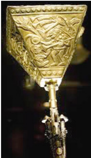
Figura 5. Representación del guerrero en el cetro hallado en la tumba del Señor de Sipán.

«este perfecto cuerpo geométrico de cuatro caras laterales y una superior, lleva en cada una la espléndida representación en relieve de un jefe guerrero ricamente ataviado que dirige su mazo de combate hacia el rostro de un prisionero desnudo, sentado y suplicante al que toma con la mano izquierda por el cabello, mano que sujeta también el escudo» (Ibíd., p. 67-68).