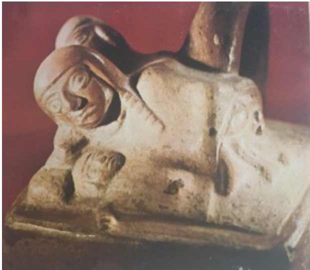
Figura 10. Representación de acto sexual en una botella escultórica Moche.

interesante sobre la reproducción y la transferencia de los fluidos necesaria para la «nutrición» de la madre y del niño.