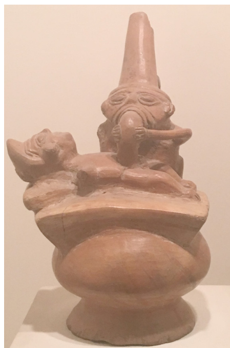
Figura 8. Representación de felación en cerámico moche. Botella erótica moche. Fuente: Fotografía de Roland J. Álvarez Chávez. Museo Larco, Lima, 2017.

En la primera pieza, incluso podría decirse que el personaje que se encuentra como felacionador tiene rasgos no humanos, lo que abre la posibilidad de si se trata de la representación de un ser divino o de un personaje mítico en una tarea de sanación o transferencia de poder, tema común en la interpretación de dichas piezas.