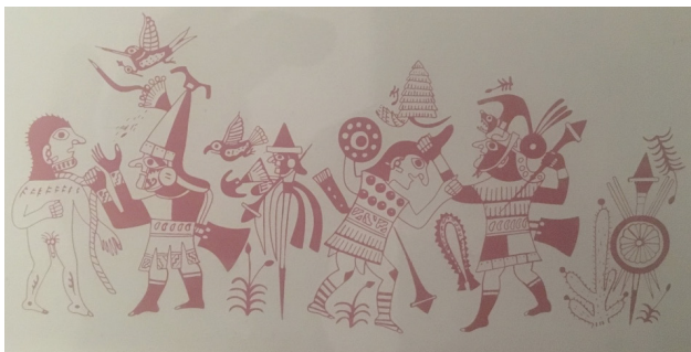
Figura 3. Iconografía que representa el duelo ritual moche. Fuente: Fotografía de Roland J. Álvarez Chávez. Museo Larco. Lima, 2017.

La actividad militar tuvo mucha importancia para los moches, y ello se evidencia en las diferentes representaciones iconográficas de guerreros con sus armas de combate, prisioneros desnudos marchando con una soga al cuello hacia el sacrificio; incluyendo al jefe guerrero y el guardián que acompañan en la tumba al Señor. Son muy frecuentes las representaciones de los enfrentamientos o duelos rituales, entre las castas guerreras en el desierto y que eran presididos por el Señor, y bajo reglas pactadas, en donde el vencido era quien perdía su tocado, y era ofrecido en sacrificio.