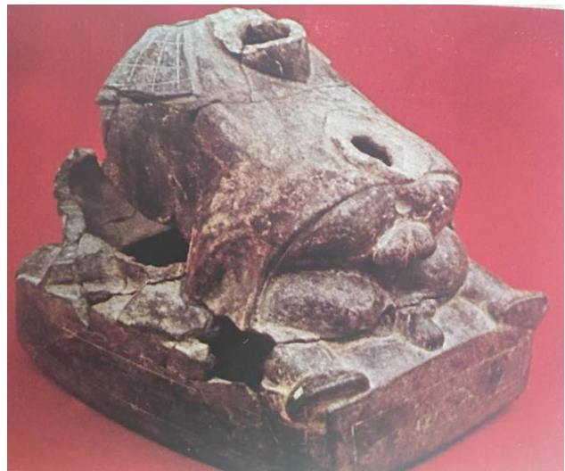
Figura 6. Representación de un acto homosexual en cerámica moche.

Cabe la pregunta, ¿dónde se encuentran todas esas piezas en la actualidad? Pues confronta lo que Kauffmann menciona como pieza única la que representa a dos hombres en un acto sexual.