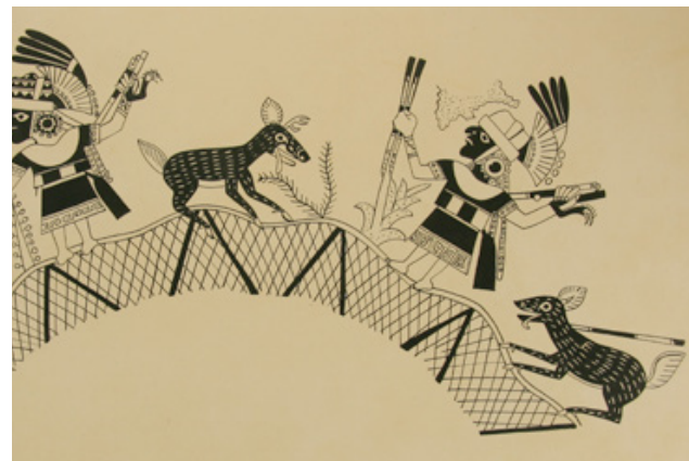
Figura 4. Iconografía que representa la caza ritual moche.