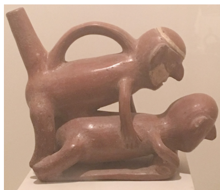
Figura 9. Representación de acto sexual en cerámico moche. Botella erótica moche. Fuente: Fotografía de Roland J. Álvarez Chávez. Museo Larco, Lima, 2017.

Por último, se muestra esta pieza donde se representa el acto sexual en el lecho, entre hombre y mujer y se aprecia la presencia de una criatura. Kauffmann la describe como un probable recurso anticonceptivo, mientras que Weismantel hace una descripción