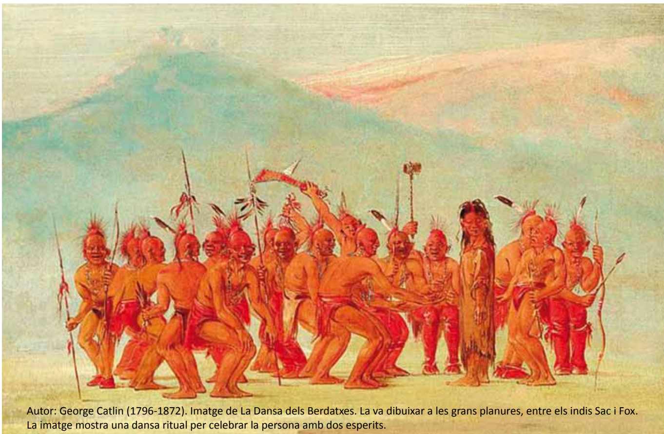
Autor: George Catlin (1796-1872). Imatge de La Dansa dels Berdatxes. La va dibuixar a les grans planures, entre els indis Sac i Fox. La imatge mostra una dansa ritual per celebrar la persona amb dos esperits.