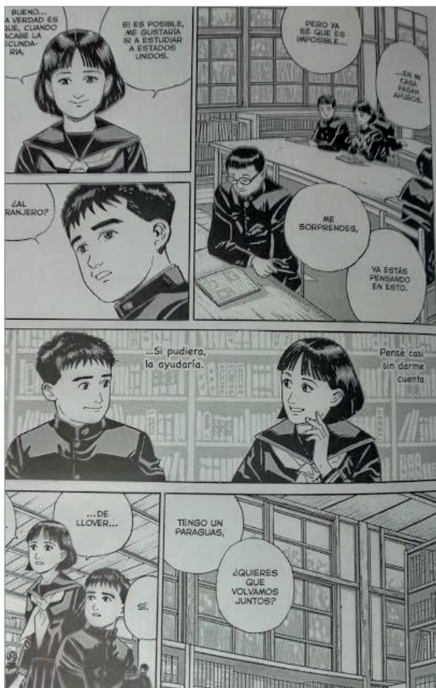
Taniguchi, Jiro (2007). Barrio lejano . Rasquera (Tarragona), Ponent Mon.

http://www.jirotaniguchi.com/2008/07/hiroshi-en-la-biblioteca-barrio-lejano.html