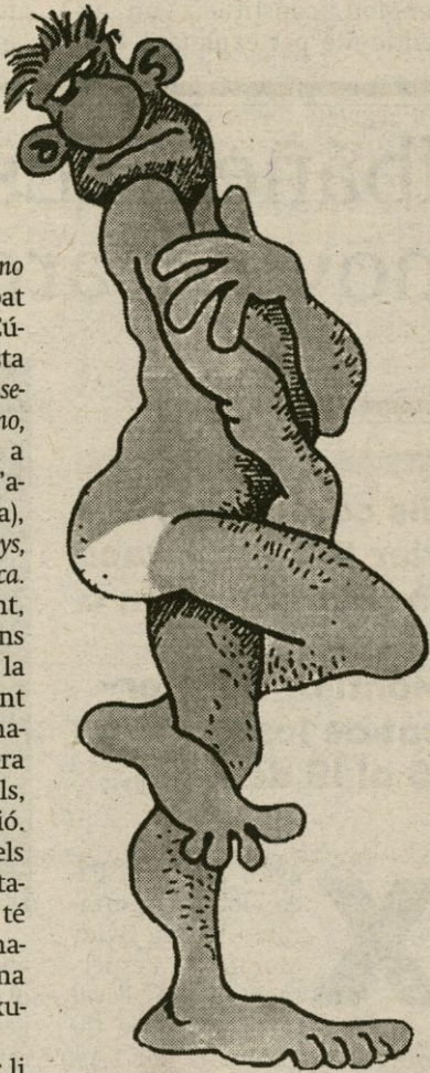
EDICIONES LA CÚPULA