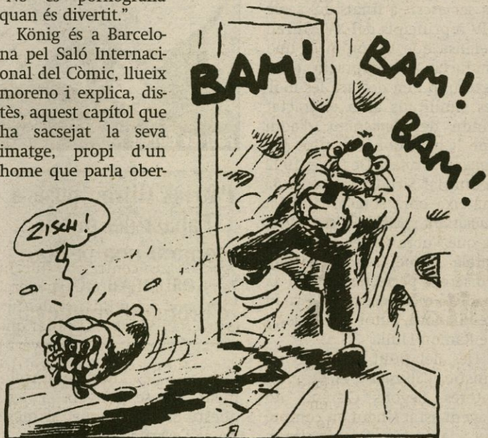
EDICIONES LA CÚPULA

permet un "enfocament més fort" del que podria prendre si treballés en altres mitjans, com la televisió o el cinema, encara que directament o indirecta-