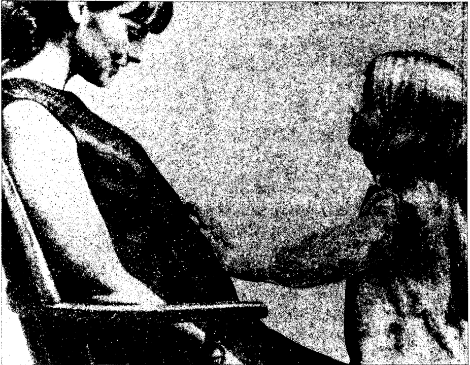
2. Fotografía núm. 9: ¿de dónde vienen los niños?

Los niños (52%) mencionan más espontáneamente que las niñas (16,5%) el embarazo, pero —al ser preguntadas— las niñas (67%) relacionan más fácilmente que los niños (15%) vientre abultado y embarazo. Finalmente un 33% de niños, contra solo 16% de niñas, no menciona ni sabe nada del embarazo y explica el voluminoso vientre porque la madre «está gorda y come mucho».