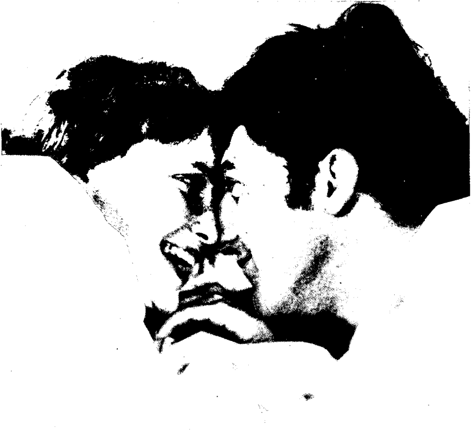
3. Fotografía núm. 11: las relaciones de la pareja.

– Nadie hace ninguna alusión directa a la vida sexual de la pareja. Con todo, casi un 20% de niños (ninguna niña) dice que han tenido un hijo, que lo tendrán o que piensan tenerlo, lo cual parece evocar indirectamente la vida sexual de la pareja.