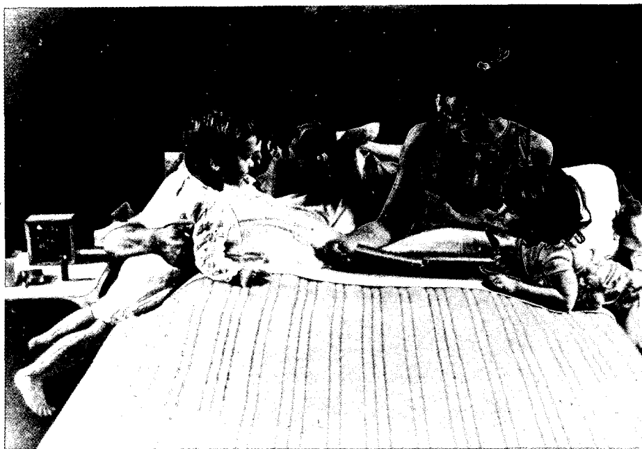
4. Fotografía núm. 8: las relaciones afectivas en el seno de la familia.

- Los niños perciben una mayor afinidad afectiva entre padre e hijo y entre madre e hija que las niñas, las cuales tienden a destacar la preferencia del padre por la madre y viceversa. Sin embargo, las niñas, al igual que los niños, declaran en su mayoría que el hijo se parece al padre y la hija a la madre.