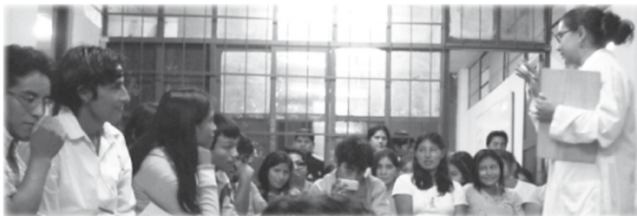
Fotografía: Hablando de sexo.