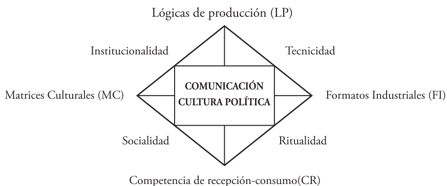
Gráfico 1. Tramas de la mediación. Véase Martín Barbero, Jesús. (2002, b).

El siguiente esquema romboidal ha sido propuesto por Martín-Barbero para definir las tramas de la mediación: