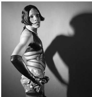
Fotograma de ¿Qué importa mi sexo?

culturales. Bogotá, Encuentro Colombiano de Investigadores en Cine. Mesa 1. Observatorio Latinoamericano de Historia y Teoría del Cine/ Universidad Nacional de Colombia/ Ministerio de Cultura.