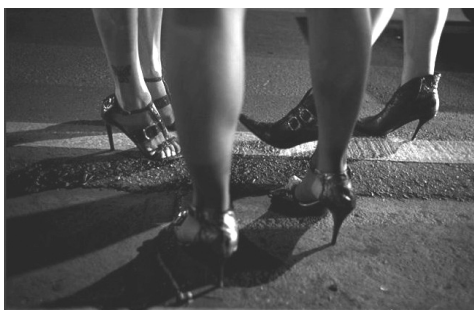
Fotograma de Pasarelas Libertadoras