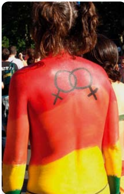
Molt sovint, la societat és homòfoba, encara que les lleis siguin favorables. Les actituds socials han de canviar.